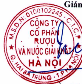
Trần Hậu Cường