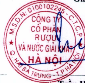
Trần Hậu Cường