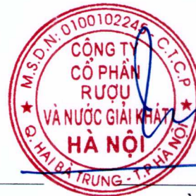
Trần Hậu Cường